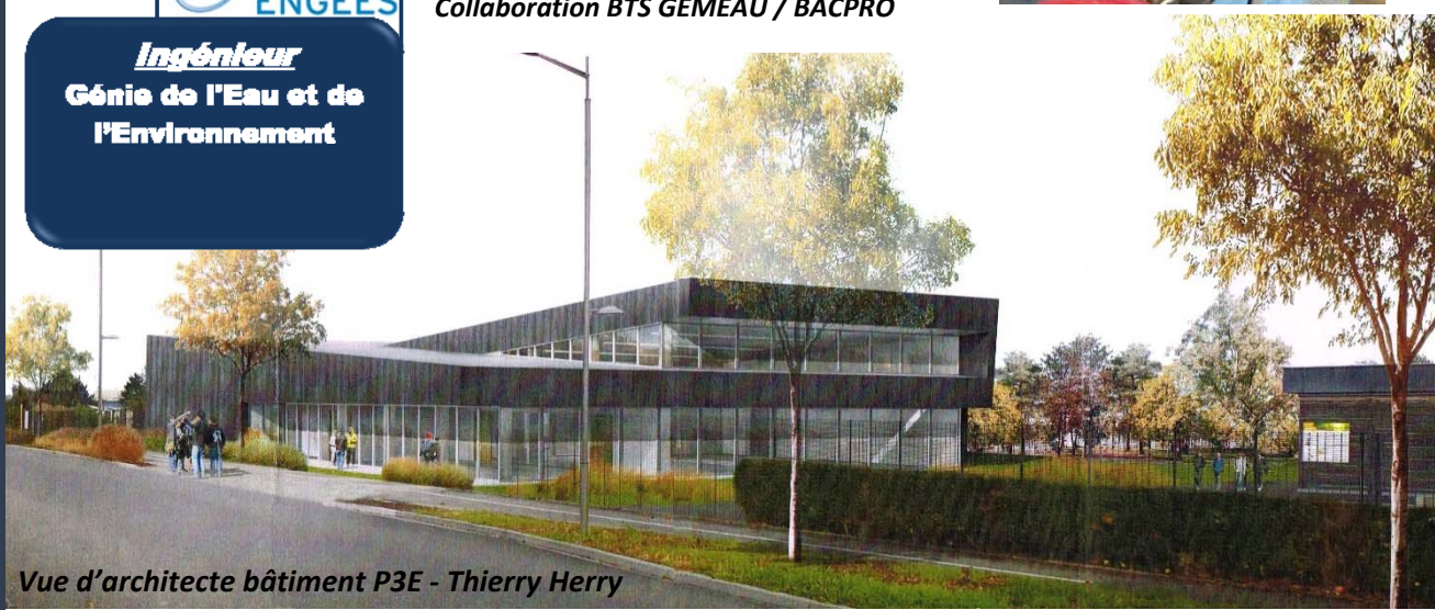
Vue d'architecte bâtiment P3E - Thierry Herry