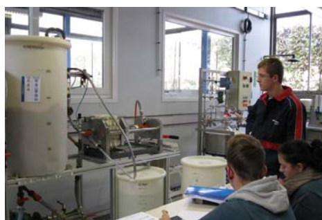
Collaboration BTS GEMEAU / BACPRO