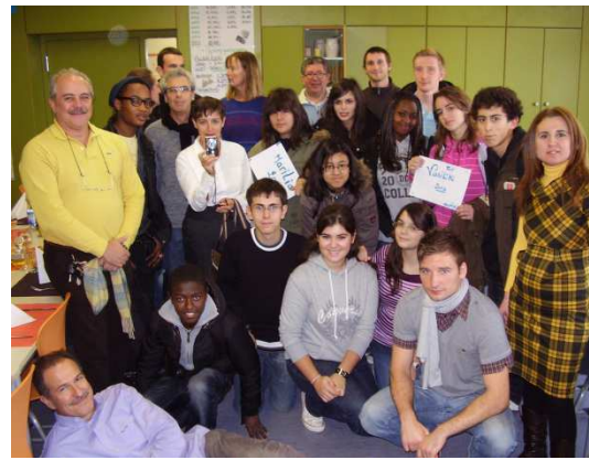
Projet à 12 partenaires européens... (Long Life Learning) 2009-2012

La sensibilisation du public est aussi un des axes de notre développement. Des panneaux qui présentent la faune, la flore, les poissons, les oiseaux et les conséquences de la pollution sont déjà en place le long de l'Ehn. Ils ont été réalisés par les élèves de TS GEMEAU.