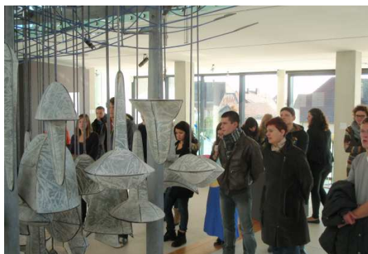
Travail sur L'art dans l'eau : Collaboration avec la fondation François Schneider, Wattwiller

Montage de projets pour favoriser l'émergence de nouvelles vocations, de nouveaux métiers, de techniques innovantes.