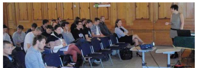
Rencontre SIVOM Communauté de Communes Obernai

Une de nos missions est d'associer les acteurs sociaux-économiques locaux à la formation des élèves de Bacpro PCEPC et BTS GEMEAU.