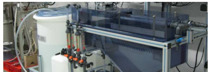
Formation GRETA sur le traitement des eaux

Au-delà de la formation sous statut scolaire et par apprentissage, sont envisagés des modules de formation et de mise à niveau pour adultes, et une ouverture de la plateforme aux entreprises et collectivités pour des éventuels besoins en démonstration technique. Un espace a été conçu modulaire et équipé pour cela.